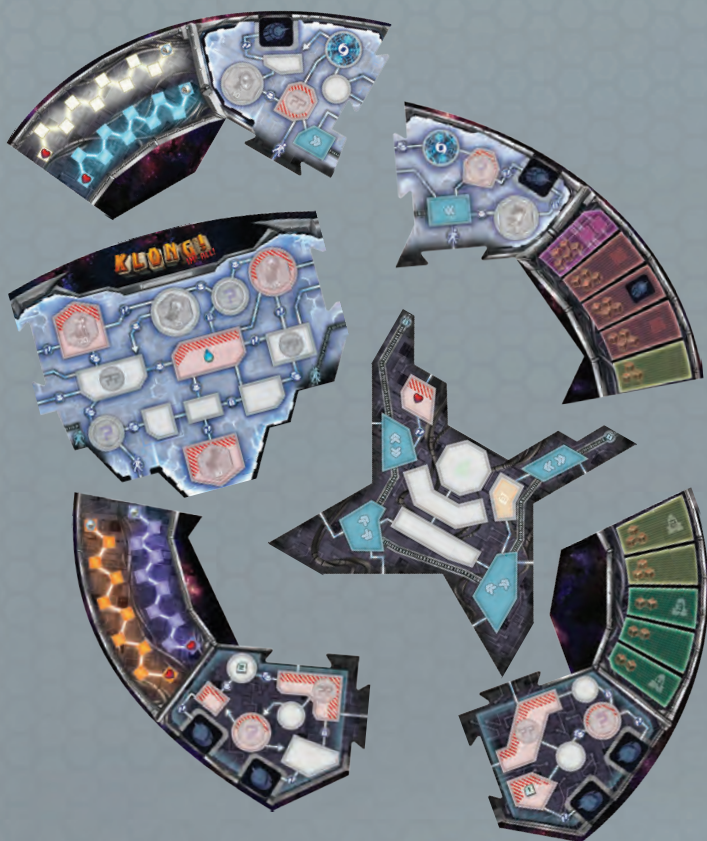
6 einseitig bedruckte Teile des Spielbretts