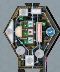
1 doppelseitiges Teil des Spielbretts